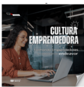
Conoce Cultura Emprendedora

Agradecemos a Endeavor México que hace posible este programa, y celebramos el entusiasmo, creatividad y determinación de quienes hoy forman parte de esta nueva generación.