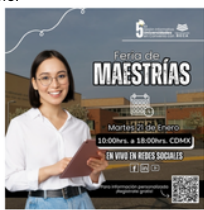
Feria de Maestrías

Iniciamos el año con nuestra 5a. Feria Virtual con Universidades en Convenio , en esta ocasión la realizamos durante 2 días para poder dar a conocer los programas de Maestrías como las Licenciaturas disponibles, con detalles sobre programas académicos, becas y oportunidades de intercambio.