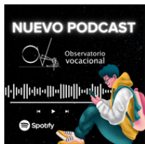
Escuchar Podcast aquí

¡Escúchalo, compártelo y súmate a esta comunidad!