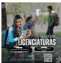
Feria de Licenciaturas

Además, seguimos contando con el apoyo de nuestros becarios, quienes continúan ofreciendo talleres inspiradores . Ellos comparten su experiencia sobre cómo estudiar en el extranjero, brindando valiosos consejos y resolviendo dudas que ayudarán a quienes desean seguir un camino académico internacional.