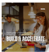
Conoce Build & Accelerate